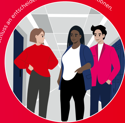
Linking: Anschluss an entscheidende Akteure und Institutionen.