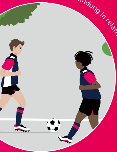
Bonding: Starke Bindung in relativ homogenen Gruppen.