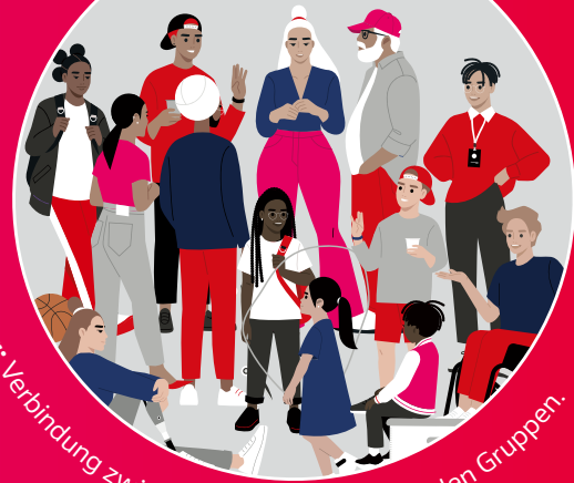
Bridging: Verbindung zwischen sich unterscheidenden Gruppen.